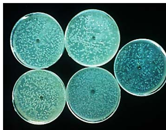
شکل ۲) رشد پنج گونه قارچ کاندیدا در برابر ایتورین A خالص خریداری شده از شرکت سیگما (چاهک)

کاندیدا/آلبیکنس قادر به تشکیل لوله زایا پس از ۲/۵ ساعت انکوباسیون در سرم خون فاقد ایتورین A یا فاقد متابولیت استخراج شده از باکتری بود (شکل ۳)، اما ترکیب لیپوپپتیدی استخراج شده مشابه ایتورین A، تشکیل لوله زایا در قارچ کاندیدا