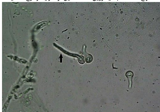
شکل ۳) تشکیل لوله زایای قارچ کاندیدا/آلبیکنس پس از ۲/۵ ساعت انکوباسیون در سرم خون (شاهد)

کاندیدا/آلبیکنس قادر به تشکیل لوله زایا پس از ۲/۵ ساعت انکوباسیون در سرم خون فاقد ایتورین A یا فاقد متابولیت استخراج شده از باکتری بود (شکل ۳)، اما ترکیب لیپوپپتیدی استخراج شده مشابه ایتورین A، تشکیل لوله زایا در قارچ کاندیدا