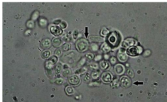
شکل ۵) عدم تشکیل لوله زایای کاندیدا/آلبیکنس تیمارشده با ۵۰ میکرولیتر ایتورین A پس از ۲/۵ ساعت انکوباسیون در سرم خون

با وجود نتایج منفی چاهک‌گذاری برای قارچ‌های مخمری به‌منظور کنترل بیشتر، میزان MIC و MFC برای قارچ‌های مخمری کاندیدا انجام شد. نتایج به‌دست آمده، رشد قارچ در تمامی لوله‌ها و رقت‌های لیپوپپتید را نشان داد، به‌طوری که در تمام لوله‌ها (مشابه لوله شاهد منفی فاقد ماده ایتورین A) رسوب مشاهده شد، که پس از تکان دادن لوله‌ها کدورت ایجاد شد. براساس نتایج به‌دست آمده از تعیین مقدار MFC در هیچ‌یک از رقت‌های لیپوپپتید استخراجی مهار رشد گونه‌های مخمری کاندیدا مشاهده نشد.