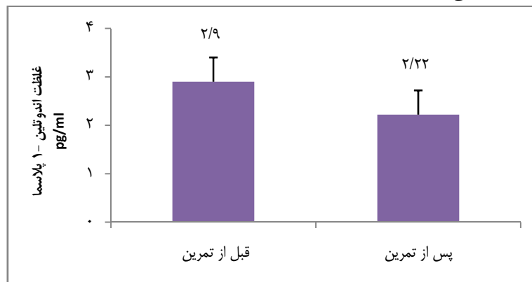
نمودار ۲: غلظت پلاسمایی ET-۱ در حال استراحت در زنان مسن قبل و پس از تمرین

خون استراحت شده است. نمودار ۲ غلظت پلاسمایی ET-۱ در حال استراحت در زنان مسن قبل و پس از تمرین را نشان می دهد. غلظت پلاسمایی ET-۱ به طور معنی داری پس از تمرین کاهش یافت (۲/۹۰ ± ۰/۲۰ در مقابل ۲/۲۲ ± ۰/۰۰۱). (p < ۰/۰۰۱)